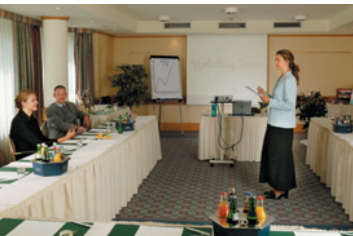
Konferenzraum / Conference Room / Salle de conférences