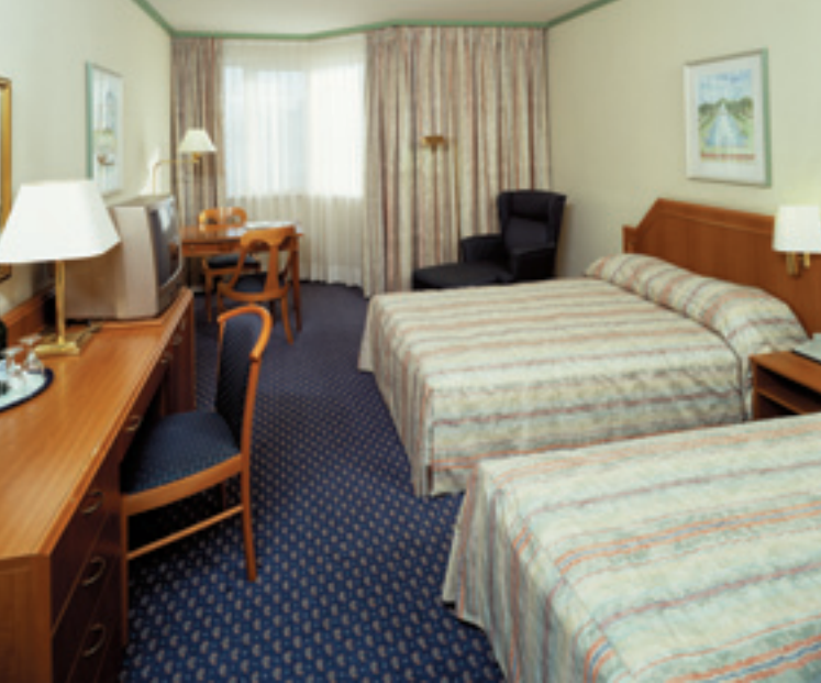
Zimmer / Room / Chambre