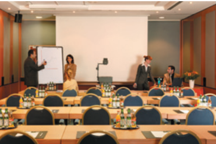
Konferenzraum / Conference room / Salle de conférence