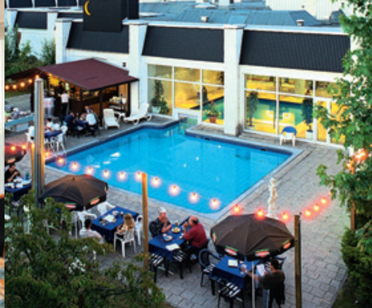
Garten / Garden / Jardin