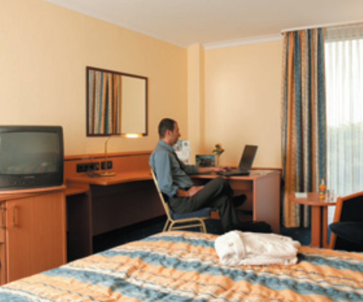
Zimmer / Room / Chambre