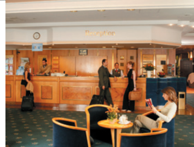
Rezeption / Reception / Réception