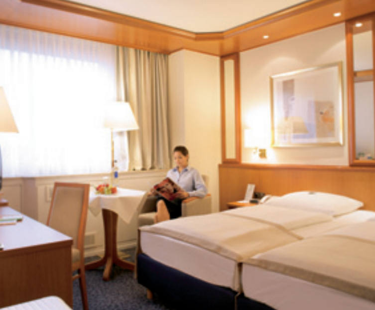
Zimmer / Room / Chambre