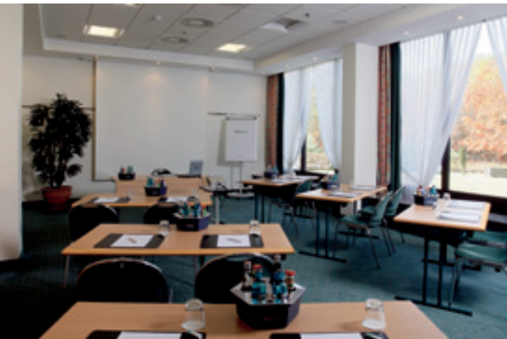
Konferenzraum / Conference Room / Salle de conférences