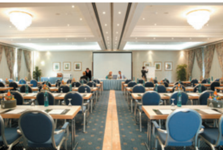
Konferenzraum / Conference Room / Salle de conférences