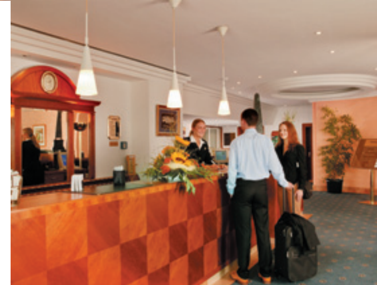
Rezeption / Reception / Réception