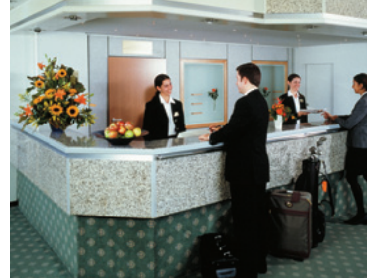
Rezeption / Reception / Réception