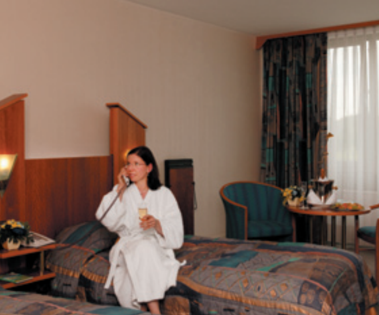
Zimmer / Room / Chambre