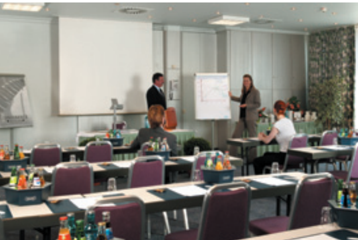
Konferenzraum / Conference room / Salle de conférence