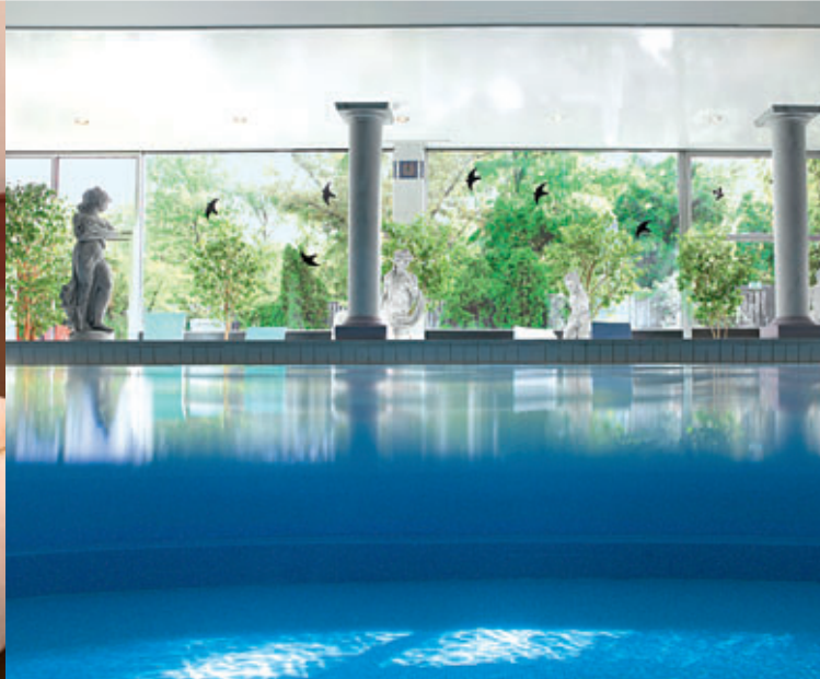
Pool / Pool