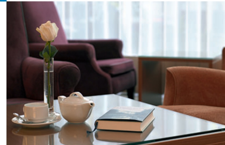
Lobby / Lobby