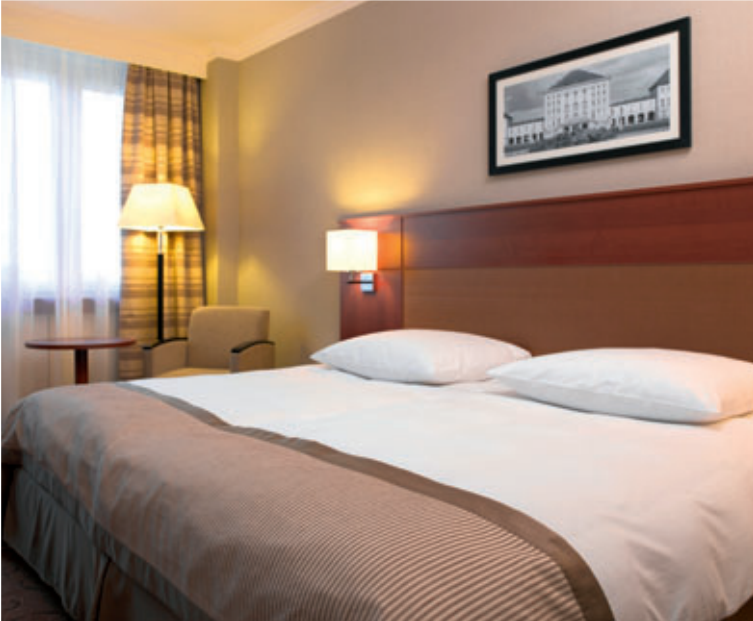
Zimmer / Room