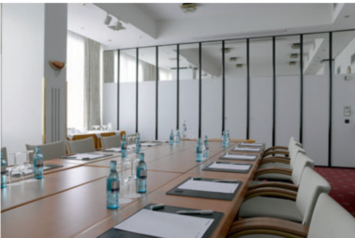
Tagungsraum / Meeting room