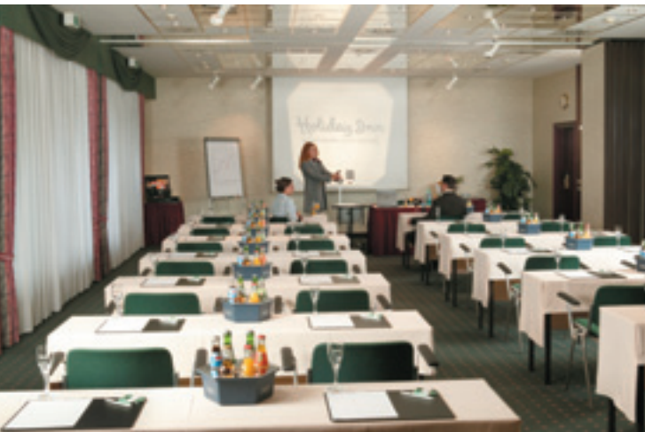
Konferenzraum / Conference Room / Salle de conférences